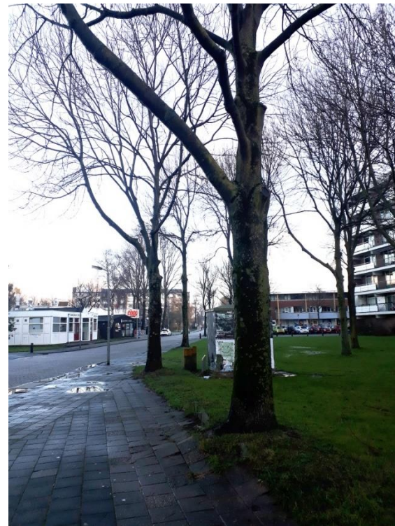
Van enkele essen langs de Neptunuslaan is de stamvoet tot binnen de bandenlijn van het trottoir gegroeid.