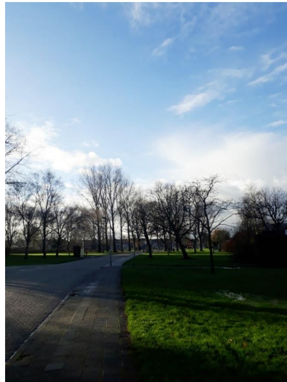
De Neptunuslaan in zuidelijke richting.