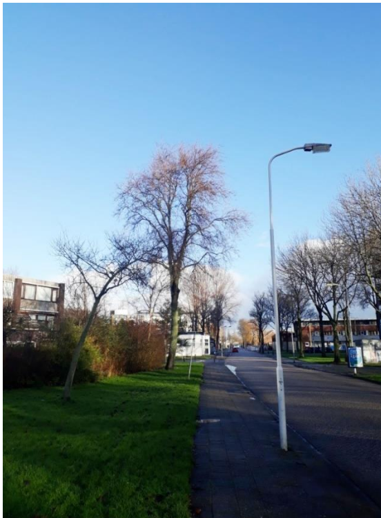
De Neptunuslaan in noordelijke richting. Links op de voorgrond boom 254. De grote boom erachter is boom 252.

Het is een zeer gevarieerd bestand. De bomen zijn verdeeld over de 52 soorten/variëteiten. Japanse sierkers ( Prunus serrulata cv.) en ruwe berk ( Betula pendula ) zijn met 32 exemplaren het sterkst vertegenwoordigd, gevolgd door gewone es ( Fraxinus excelsior ) en haagbeuk ( Carpinus betulus ) met ieder 22 en Canadapopulier ( Populus x canadensis ) met 20 exemplaren. Van de overige soorten/variëteiten zijn minder dan 15 bomen aangetroffen en in de meeste gevallen slechts één of enkele. Hieronder enkele overzichtsfoto's.