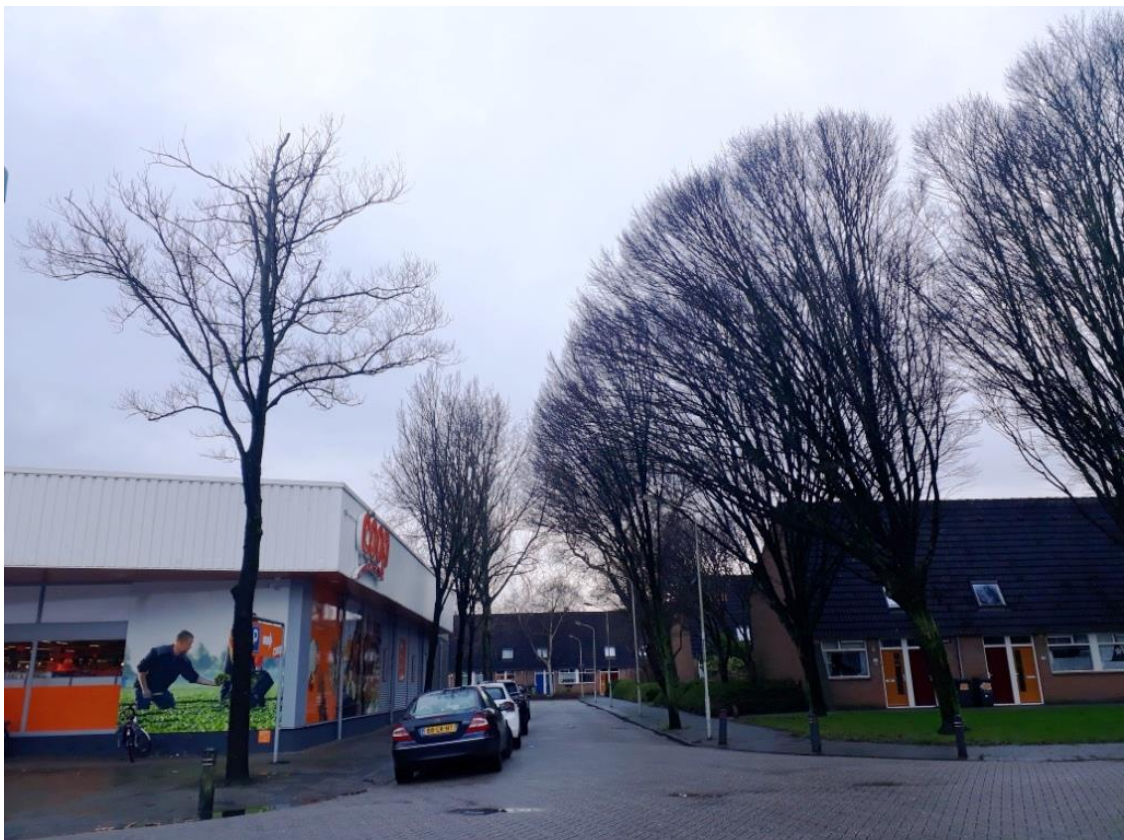
Links op de voorgrond boom 340 met afstervingsverschijnselen. Rechts ervan haagbeuken. Het is goed mogelijk dat de bomen in de verharding langs de supermarkt even oud zijn als de bomen in het veel gunstiger gazon.