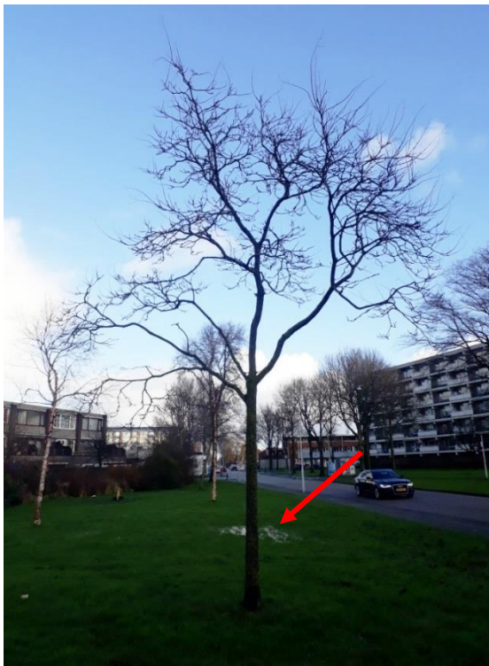
Gazon langs de Neptunuslaan met enkele relatief jonge bomen. Bij de pijl is plasvorming op het gazon zichtbaar.