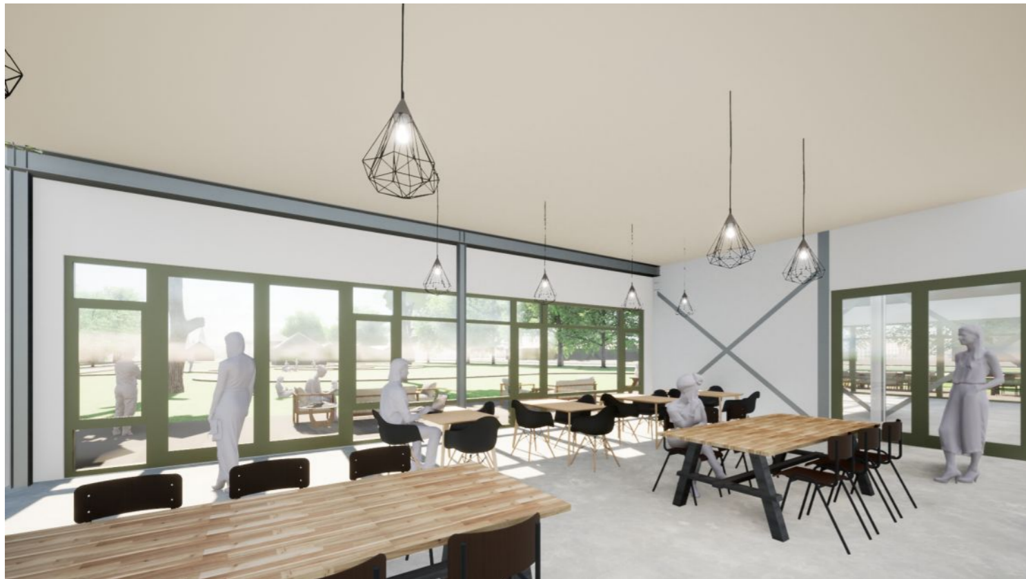
Impressie cafe restaurant