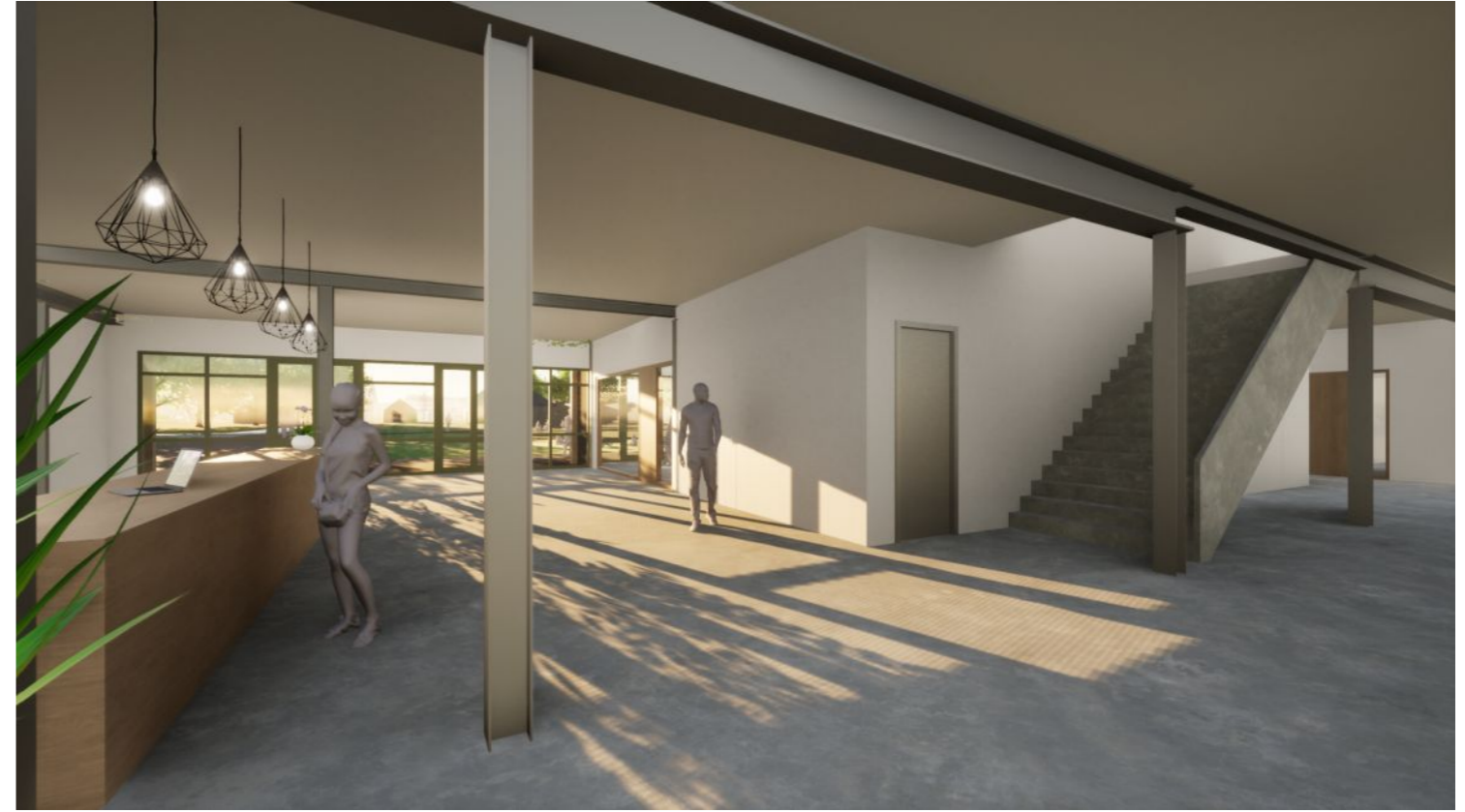
Impressie centrale hal