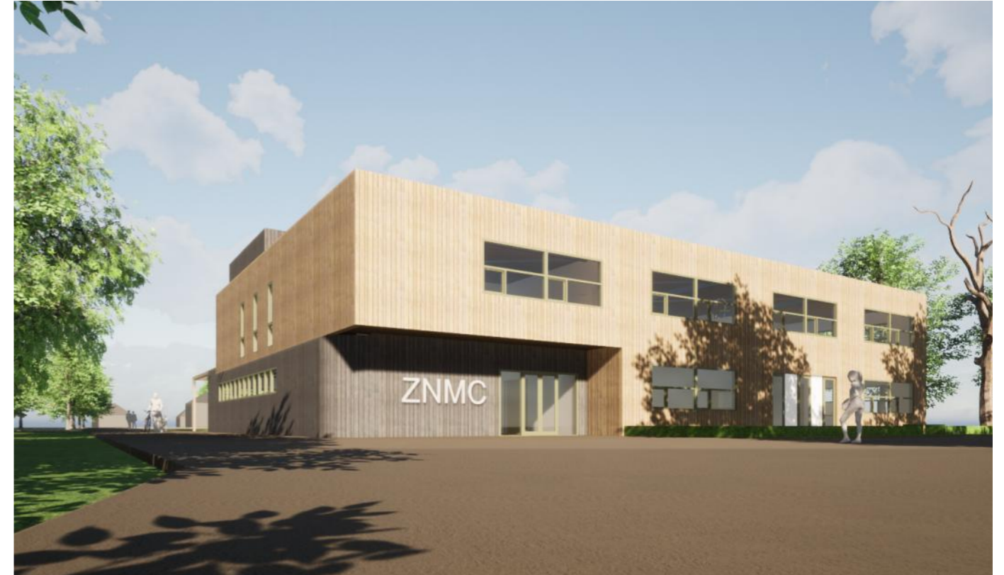
De Octant opnieuw opgebouwd in het Darwinpark als huisvesting voor het ZNMC