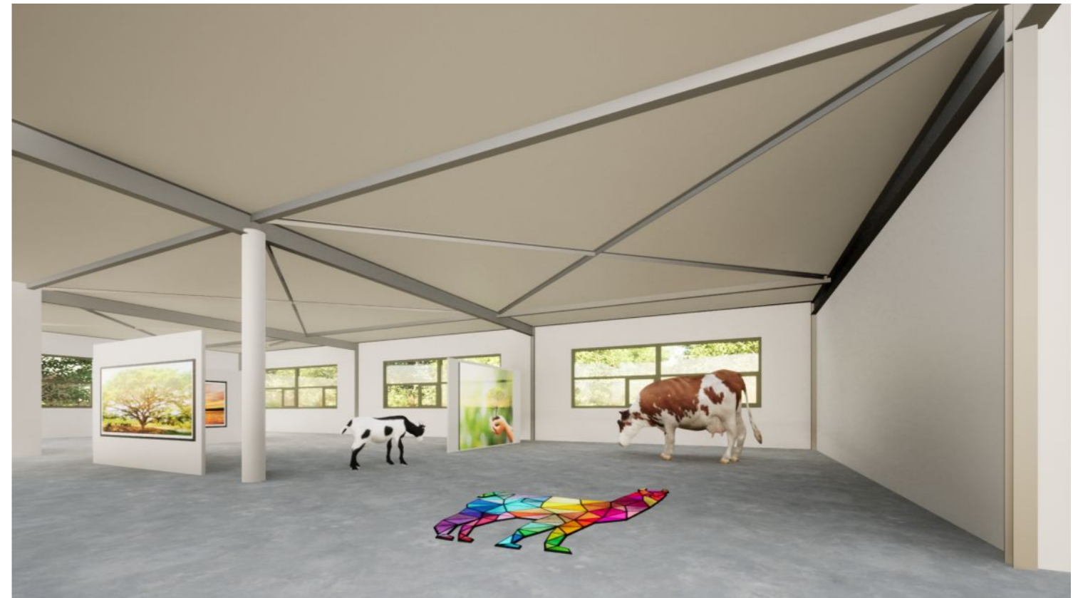
Impressie tentoonstellingsruimte ZNMC