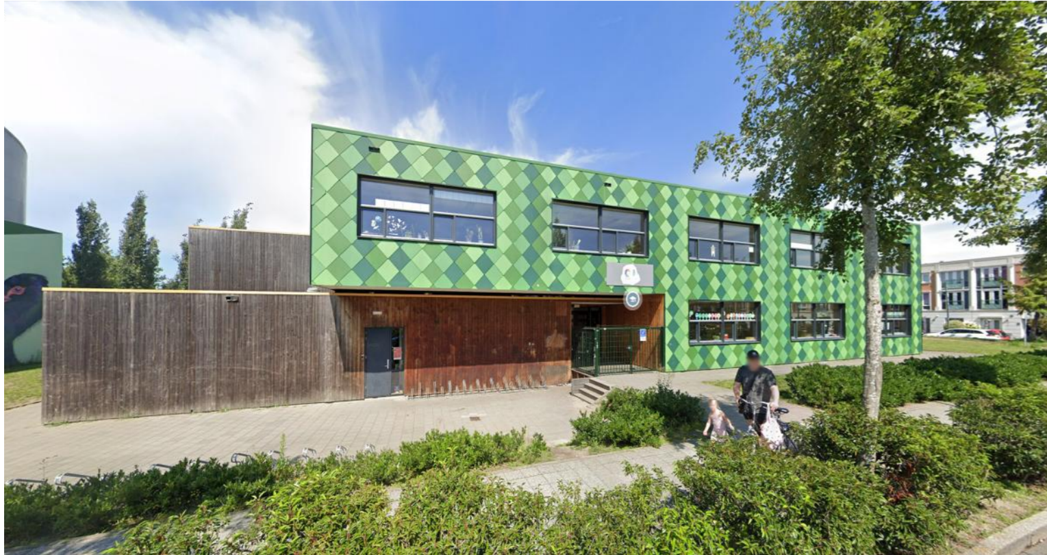
Schoolgebouw de Octant in de huidige situatie in Assendelft