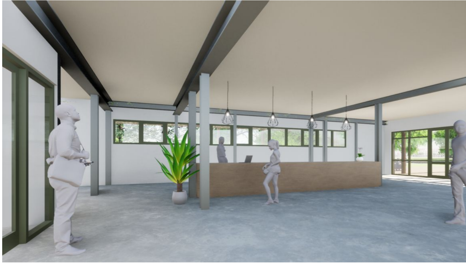
Impressie entree ruimte met welkomstbalie ZNMC