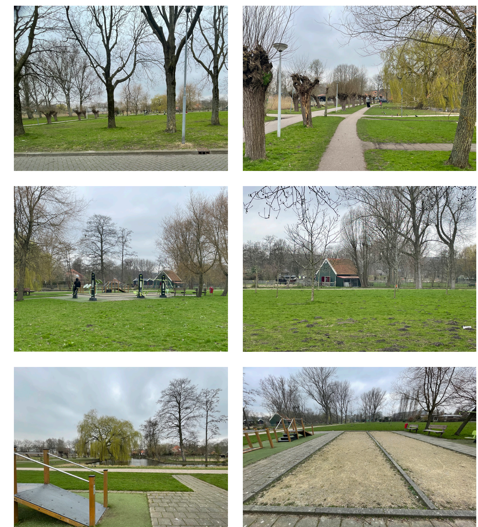
Foto's huidige situatie

De sportplaats is via twee wandelpaden te bereiken waarbij de paden logischerwijs aansluiten op de huidige padenstructuur.