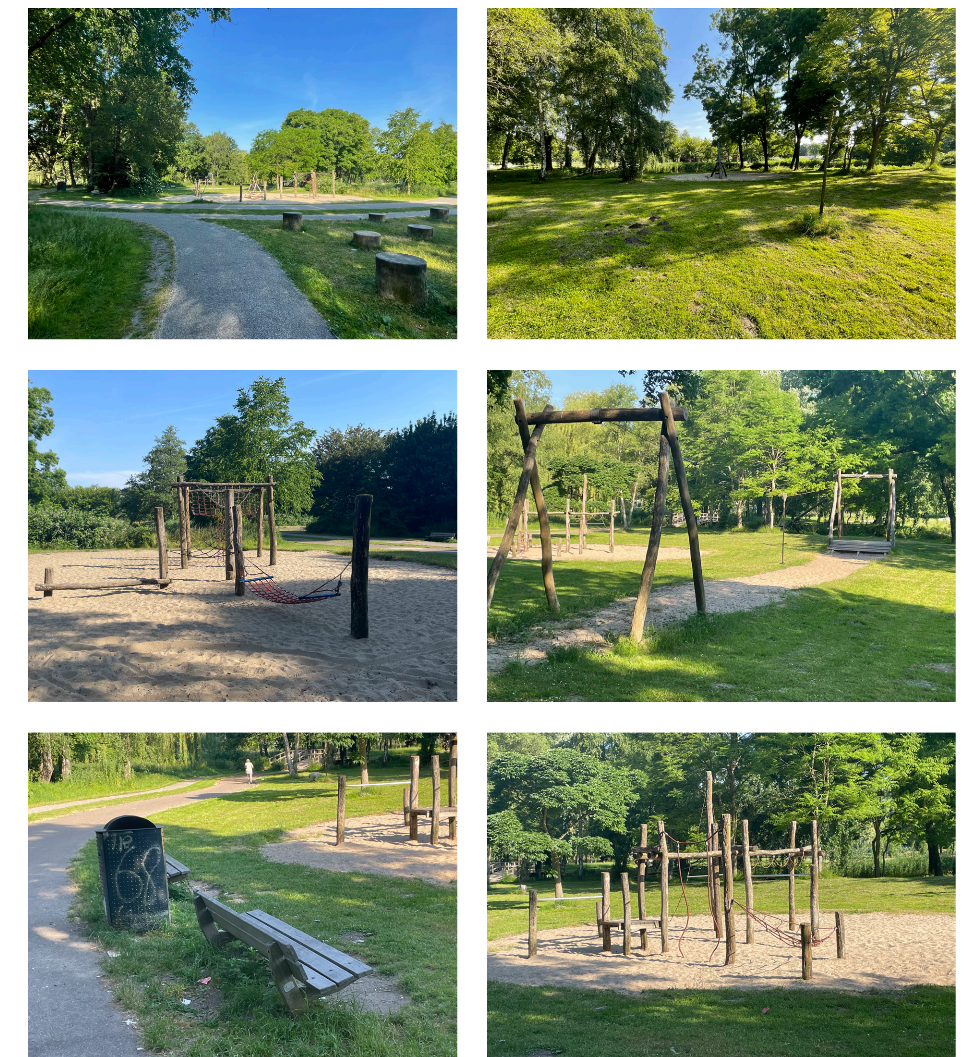
Foto's huidige situatie

Ook is er een avonturen pad toegevoegd aan het ontwerp. Een olifantpaadje met groen, een plas-dras locatie met oversteekelementen als een wiebelbrug en boomstam. Onderweg kom je verschillende balanceerelementen tegen. Er worden naast meer groen, zoals struiken, ook een paar extra bomen toegevoegd voor schaduw op de speelplaats. Eén van de bomen kan zelfs uitgroeien tot een echte klimboom. Voor ouders en grootouders zijn er diverse banken om in de buurt van de kinderen te genieten van het mooie Darwinpark en om andere mensen te ontmoeten.