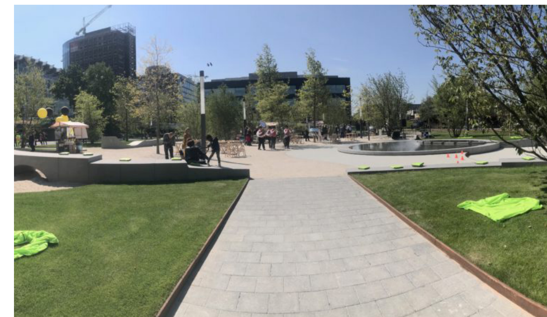
Referentiebeelden, pierenbad Vijfhoekpark Amsterdam