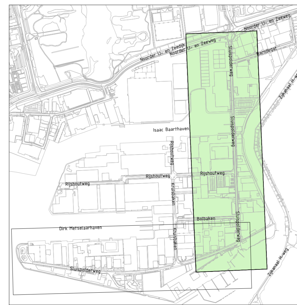
Overzicht situatie Schaal 1:1000