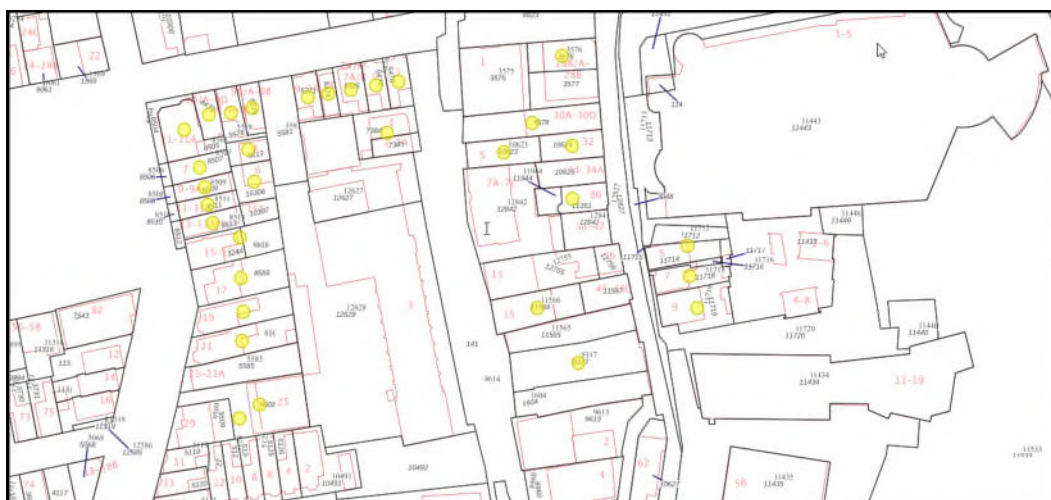
Figuur 1: Onderzoeklocaties binnen cluster (met gele cirkels weergegeven). In de tekening zijn ook adressen weergegeven die op voorhand zijn afgevalen van onderzoek.

Het onderzoek heeft betrekking op de adressen Czarinastraat 15 t/m 21, 29 (oneven genummerd), Cornelis Calffstraat 4, 6, Krimp 1+2, 5 en Hogendijk 5, 7, 9 en 36 in Zaanadam. De adressen binnen het cluster (13 in totaal) zijn in onderstaande figuur met gele cirkels weergegeven.