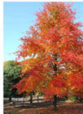
Nyssa sylvatica (roosje)