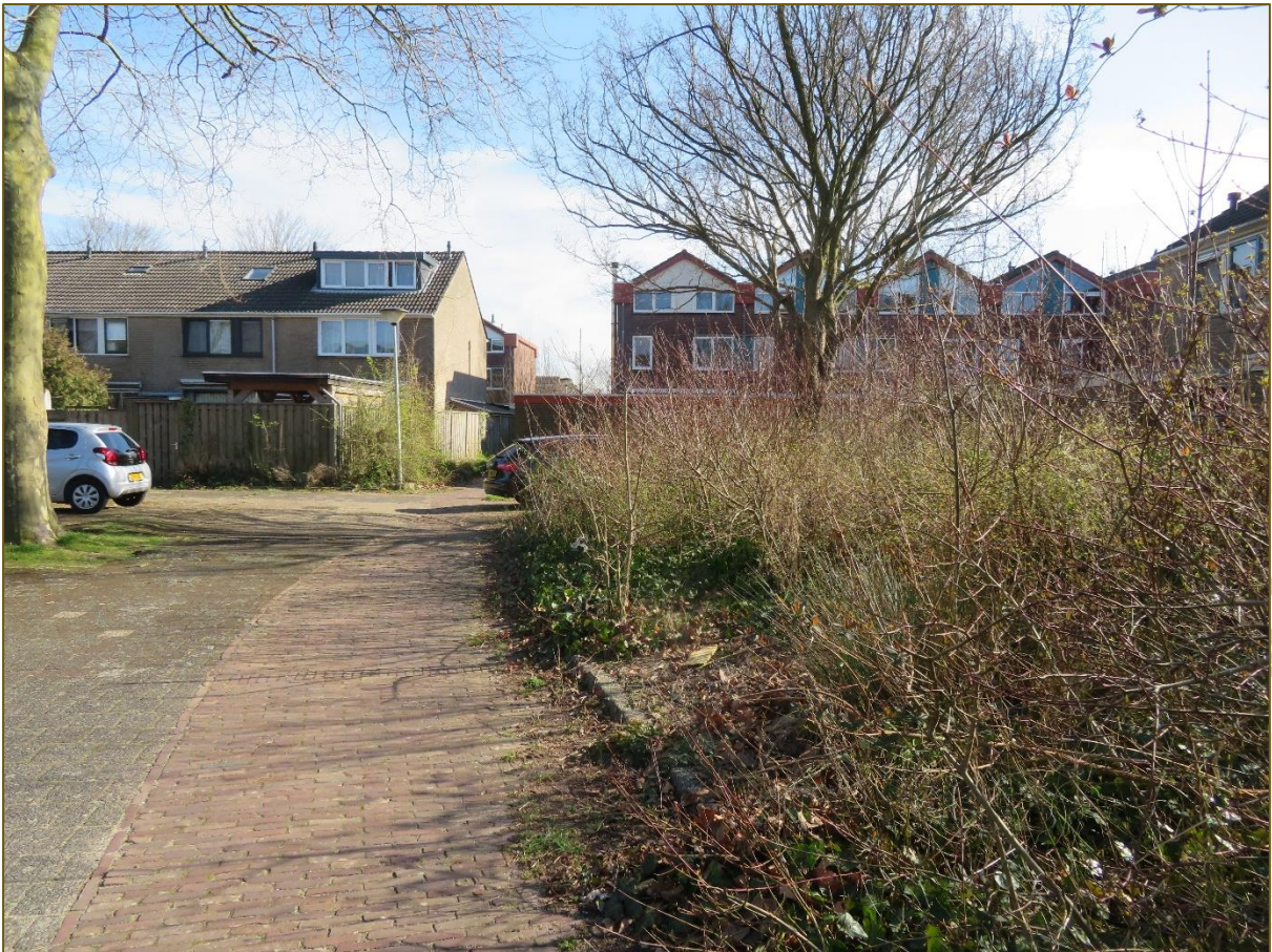
Afb 7: Heestervak met enkele bomen