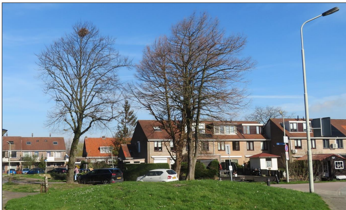
Afb 9: Eén van de bomen met nest

Er zijn in de bomen geen holtes of andere scheuren aangetroffen welke gebruikt zouden kunnen worden door vogels of vleermuizen als verblijfplaats.