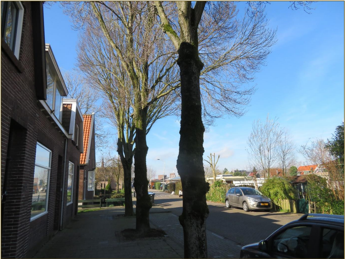
Afb 8: Bomen in verharding