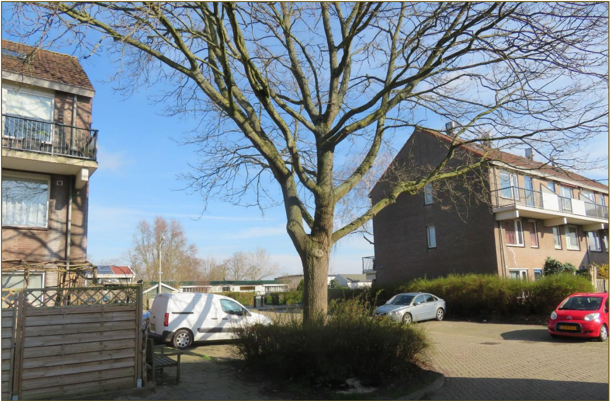
Afb 6: Solitaire bomen, hier met enige onderbegroeiing