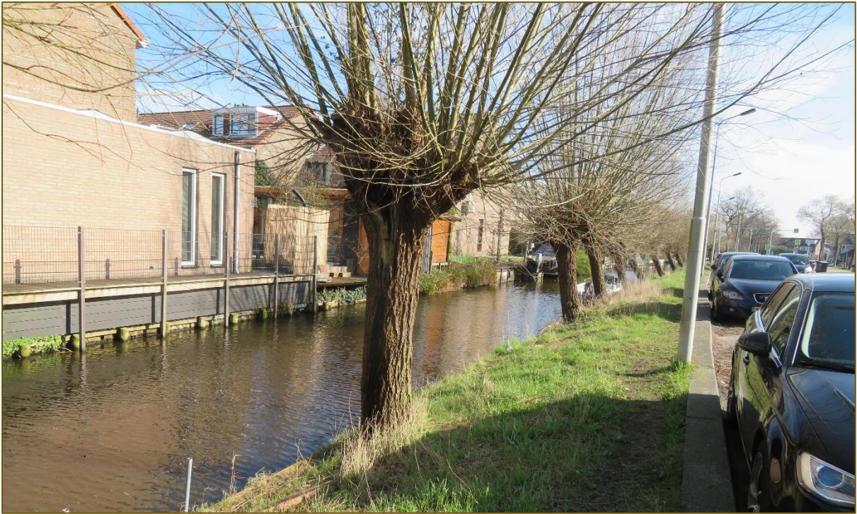
Afb 4: Hier met knotbomen