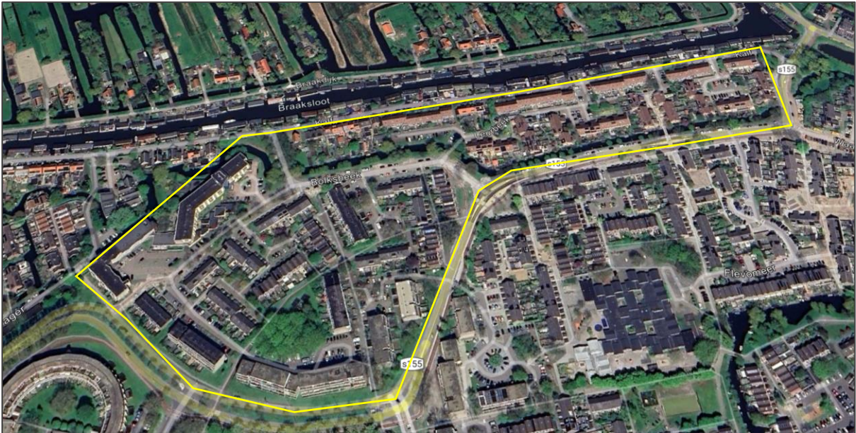
Afb 2: Bij benadering de begrenzing van het projectgebied

Zie onderstaande foto's voor een impressie van het aanwezig groen in de wijk.