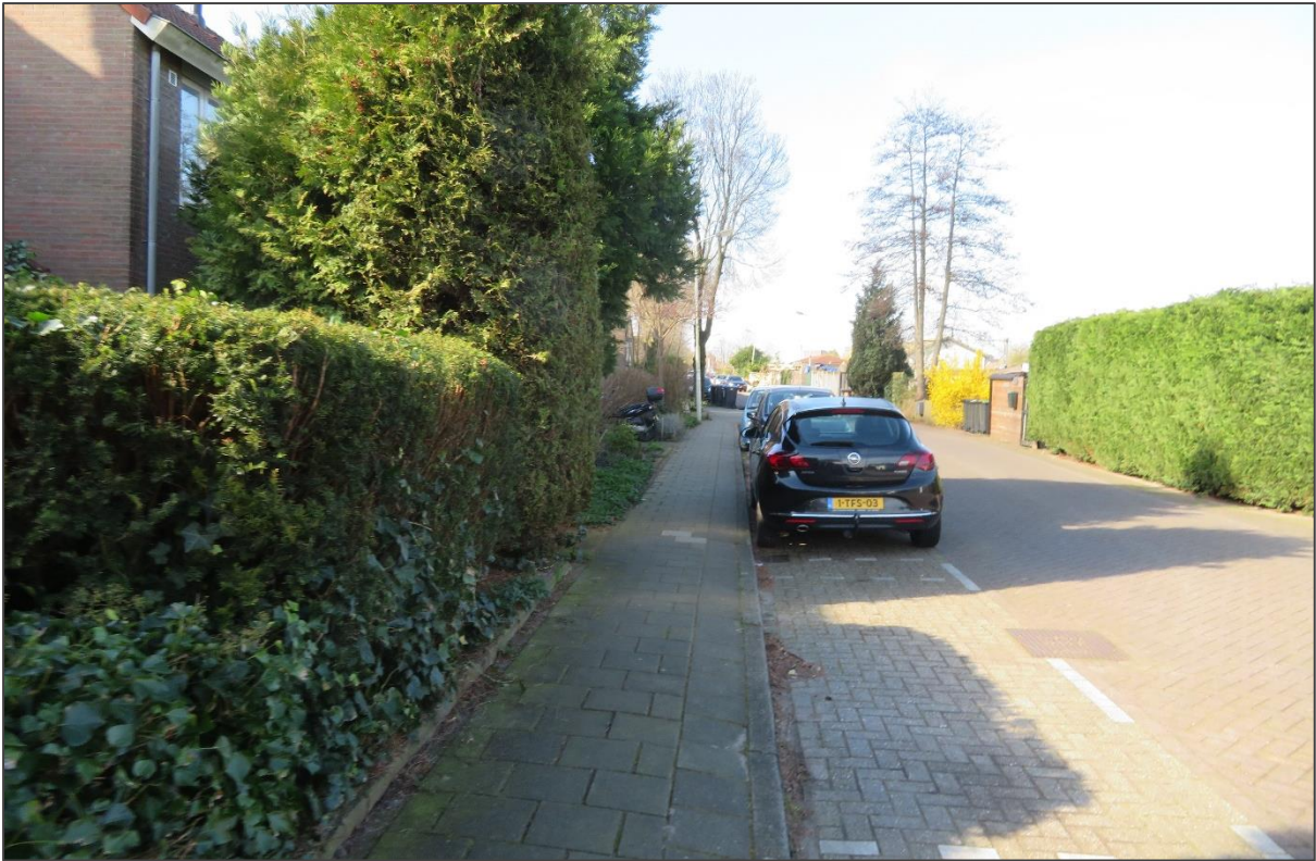
Afb 10: Bosschages zijn vaak te dicht om een nest waar te kunnen nemen. In de bosschages kunnen kleine zoogdieren aanwezig zijn