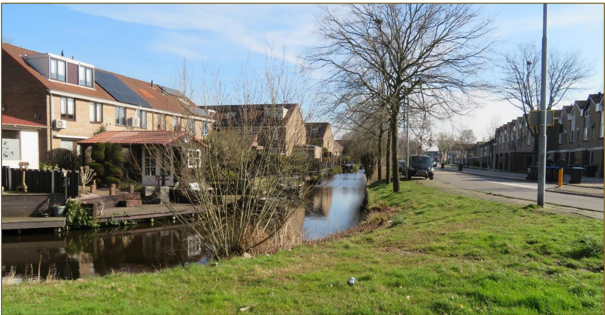
Afb 3: Grasstrook langs een watergang met bomen

Zie onderstaande foto's voor een impressie van het aanwezig groen in de wijk.