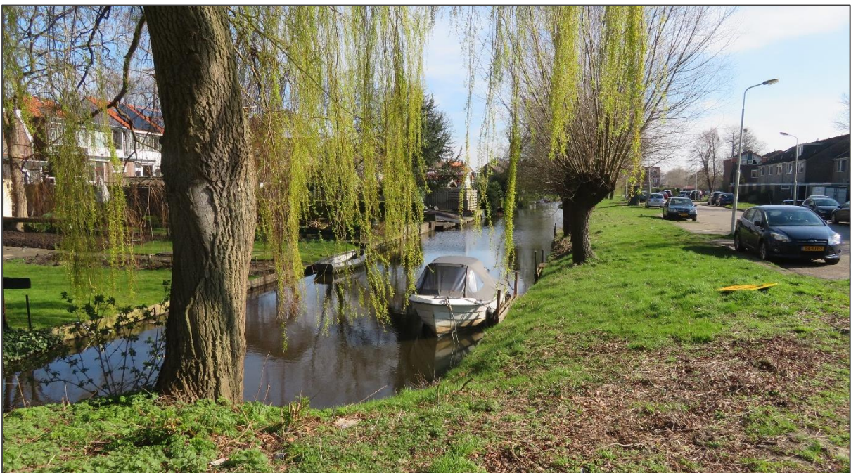
Afb 11: In/dichtbij de watergangen kunnen vogels nestelen

Verspreid in de wijk zijn er diverse grasstroken aanwezig waarin/waaraan mogelijk gewerkt wordt. Alle grasstroken worden intensief onderhouden. In grasstroken langs watergangen kunnen amfibieën zitten. Ook is hier de kans aanwezig dat er dicht bij de oevers genesteld gaat worden door diverse watervogels zoals eenden en meerkoeten. In het voorjaar/zomer kunnen ook jonge vogels in het hoge gras zitten.