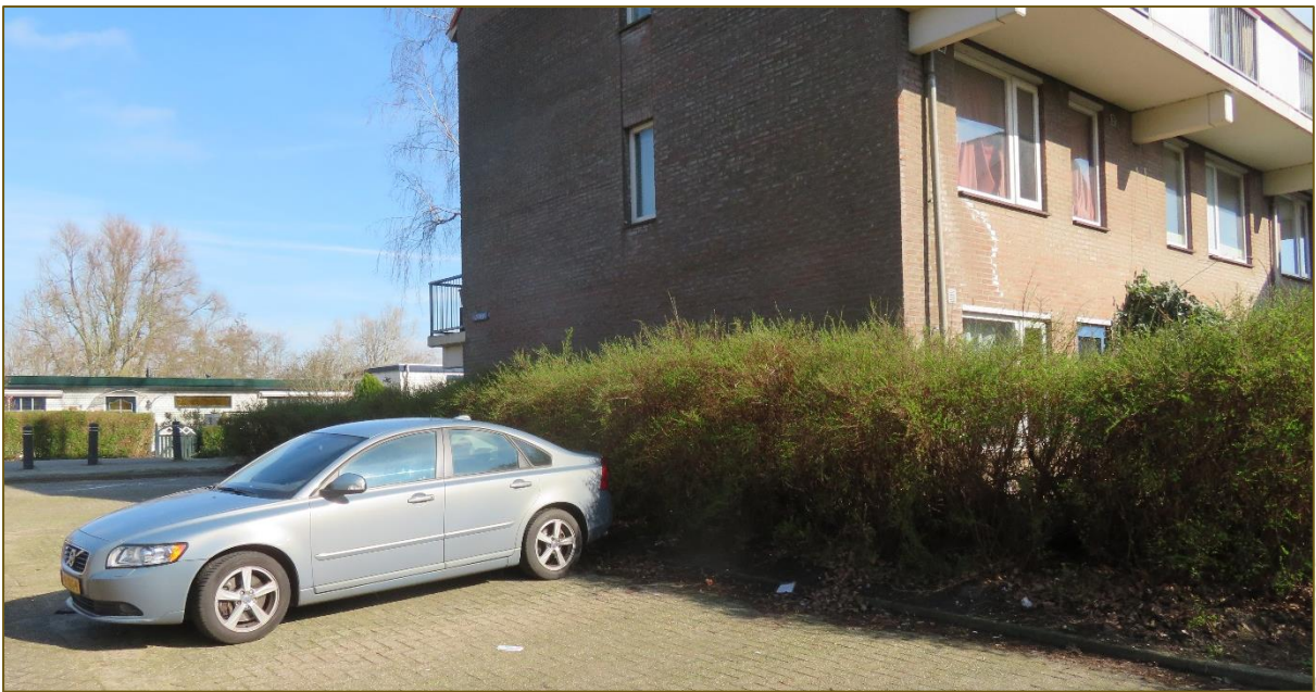
Afb 5: Openbaar groen, hier een heestervak