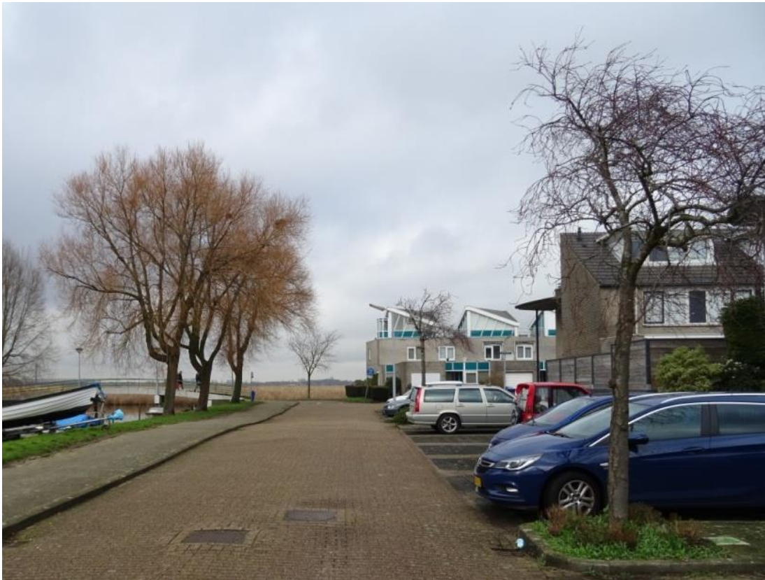
Links de schietwilgen en rechts een voorjaarskers

Vorbij de bocht stonden voorheen voorjaarskersen ( Prunus subhirtella 'Autumnalis Rosea') in de boomoren tussen de parkeervakken. Daarvan resteren er nu nog vier. De overige zijn vervangen door jonge esdoorns ( Acer pseudoplatanus ). De sierkersen vertonen een redelijke groei maar bij twee van de bomen treedt scheutsterfte op of is zelfs een deel van de kroon afgestorven. De esdoorns zijn recent geplant en vertonen een goede groei.