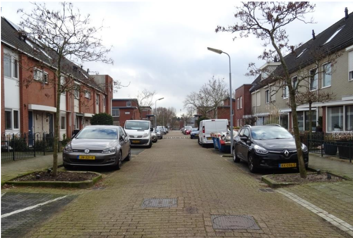
Pluimessen aan weerszijden van de Irving Berlinstraat