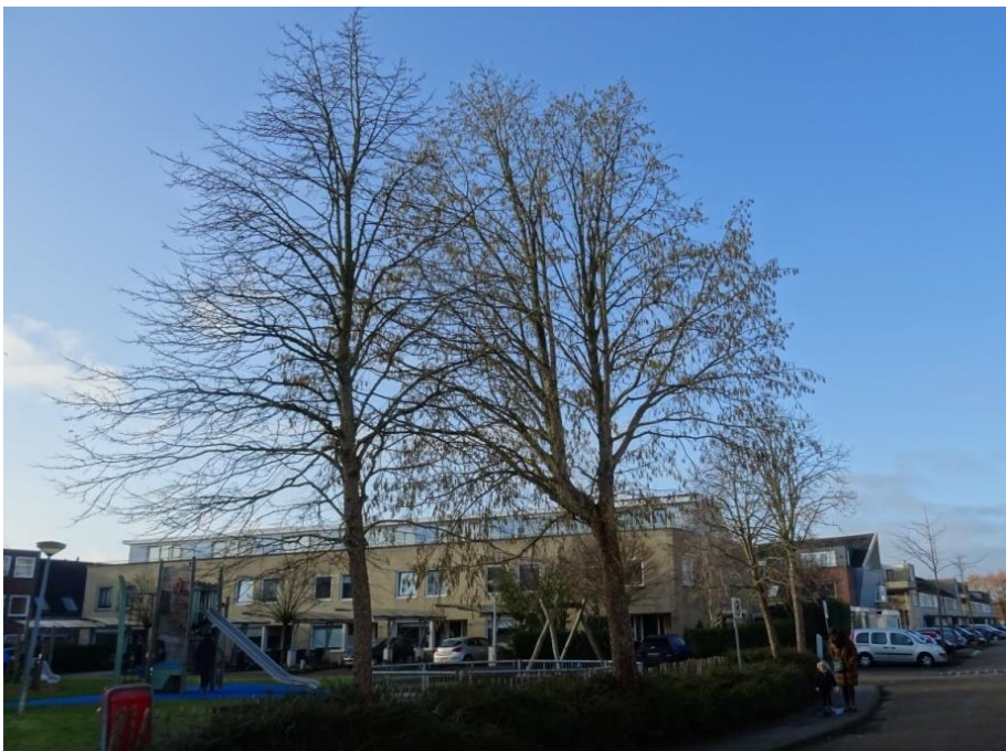
Boomhazelaars met in de middelste boom de zware zuiger die de kroon overneemt

In deze straat staan acht soorten bomen. In de boomoren tussen de parkeervakken langs deze weg staan 17 Japanse notenbomen. Deze halfwas bomen vertonen een overwegend goede groei. Enkele exemplaren zijn bij het parkeren beschadigd geraakt. Bij de bomen 115 en 116 gaat het om omvangrijke beschadigingen.