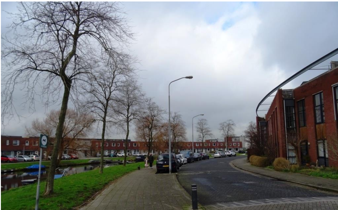
Rij robinia's in de George Gershwinstraat

In dezelfde rij staan solitaires van de tulpenboom en hemelboom. Ze vertonen een matige en redelijke groei.