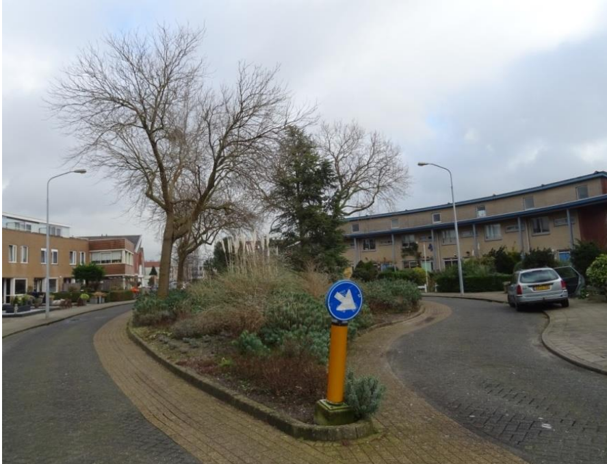
'Eiland' met zwarte moerbeien en blauwe ceder

In een eilandje, daar waar de rijbaan splitst, staan de drie zwarte moerbeibomen en de blauwe ceder. De bomen staan in de open grond te midden van enkele kleinere boompjes en heesters. De moerbei is een nauwelijks gebruikte soort in het stedelijk groen en exemplaren van dit formaat zijn uitzonderlijk. Ze vertonen een goede groei. De stam van deze bomen vorkt op 3 meter hoogte. De ceder vertoont een redelijke groei en heeft geen gebreken.