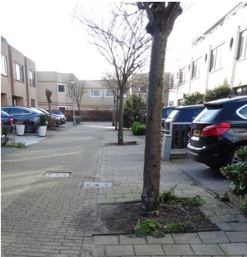
Riooltracés in de Nat King Colestraat

In de Nat King Colestraat en Lil Hardinstraat is het niet mogelijk het riool te vervangen zonder omvangrijke schade aan de beworteling en kroon aan te richten. Dit mede ook vanwege de lage, brede kronen. Vanwege de relatief beperkte levensverwachting van deze bomen, 5 à 10 jaar, adviseren we om deze bomen te verwijderen en na de vervanging nieuwe bomen te planten. Daar kunnen dan goed ingerichte groeiplaatsen worden aangelegd. Om vergelijkbare problemen in de toekomst te voorkomen, adviseren we tevens om de tracés verder uit de boom te leggen.