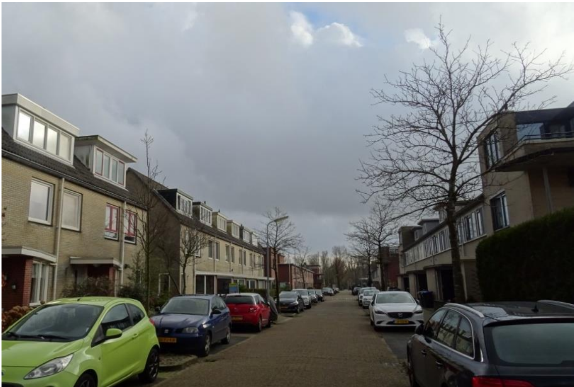
Meelbessen in de Leonard Bernsteinstraat

Aan weerszijden van de rijbaan staan hier in totaal tien meelbessen ( Sorbus aria ) in de doorgaande parkeerstroken en voetpaden. Ze vertonen een matige tot slechte groei. Recentelijk zijn drie bomen vervangen. De groei van deze jonge bomen is nog goed. Deze jonge bomen zijn overigens te ondiep geplant.