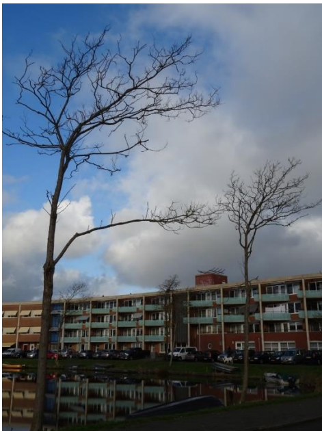
De robinia's met de nummers 86 en 87 en hun (zeer) open kronen

De robinia's met de nummers 86, 87, 90, 92 t/ 96, 177 en 210 vanwege hun beperkte levensverwachting