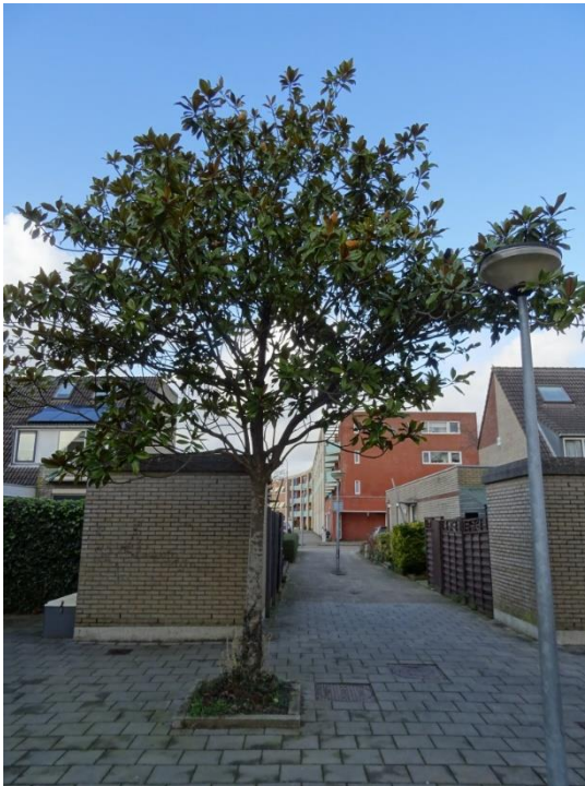
Beverboom met rioolput dicht naast boomspiegel

De beverbomen staan in de tegelverharding, verspreid over een speelpleintje. Ze vertonen een redelijke groei. Boom 6 heeft een stambeschadiging over een lengte van 2 meter.