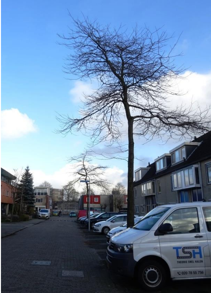
Valse Christusdoorns in de Count Basiestraat met hun kroon tot boven de riooltracés

Tevens komen de kronen van de valse christusdoorns tot ruim boven de tracés. Er zal ter plekke van de bomen zeer voorzichtig gewerkt moeten worden om schade aan deze kronen te voorkomen. De veiligste optie is de inzet van kleiner materieel en anders een combinatie van een goede instructie en toezicht.