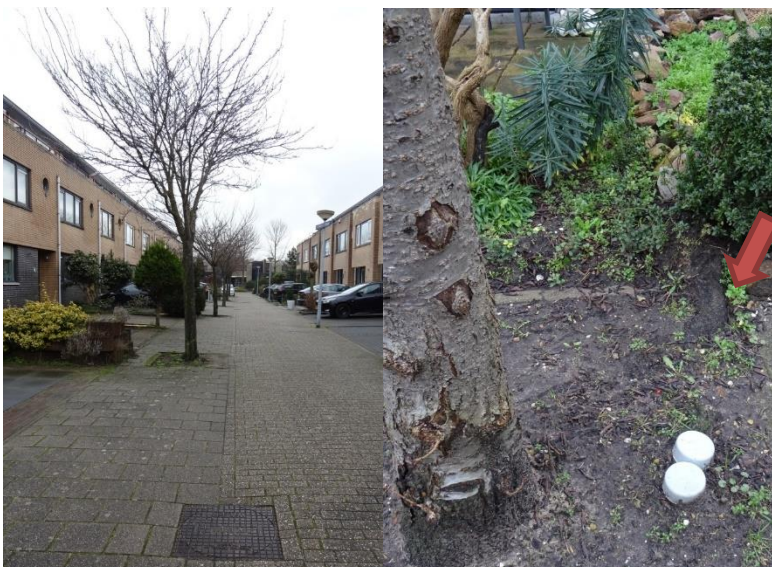
Lil Hardinstraat, met rechts een ontsnappende wortel

De Japanse sierkers vertoont eveneens geen groei meer. De boom staat in een parkeerstrook.