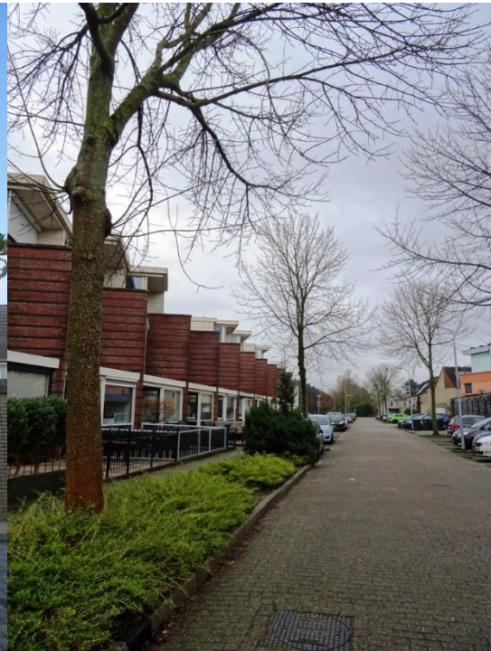
Zachte essen in de Louis Armstrongstraat