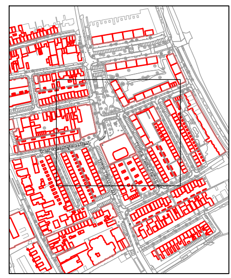
Situatie Schaal 1:2000